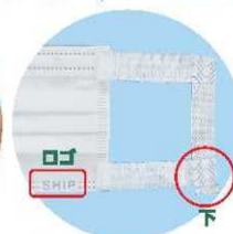
耳掛け部分の突出を下にして、SHIPのロゴが正しく読める側が、外側です。